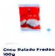
Coco Ralado Fredão 100g