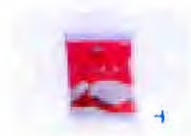
Coco Polado Fredão 100g